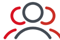
Freundes- und Familienkreis-Berater